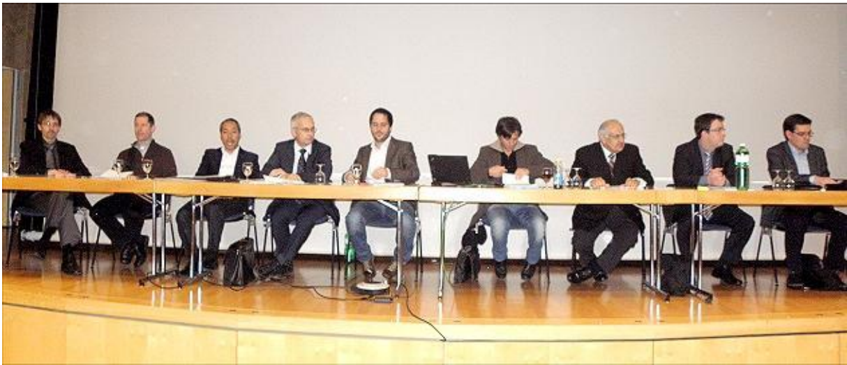
Pamje nga podiumi